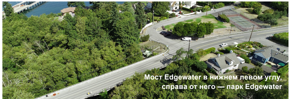
Мост Edgewater в нижнем левом углу, справа от него — парк Edgewater